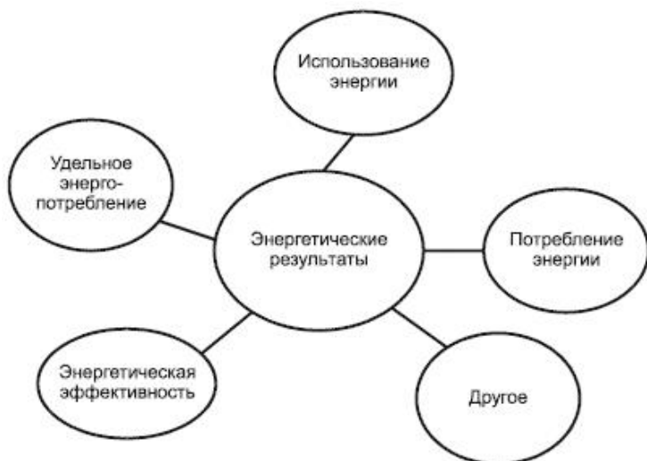
Рисунок А.1 - Концептуальное представление энергетических результатов